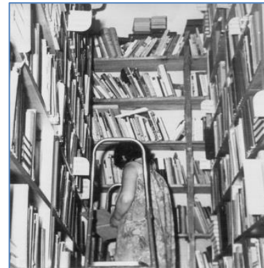
Библиотека 1958 г.