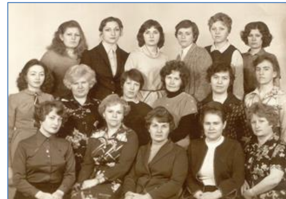
Коллектив библиотеки 1981 г.

Рос институт, совершенствовалась библиотека. Все прогрессивные формы библиотечного обслуживания были подхвачены и использованы в работе библиотеки: это открытый доступ к фондам, дифференцированное обслуживание читателей, пакетный метод обслуживания первокурсников, безынвентарный учет, беззаписная система и т.д. Иллюстрацией служит выдержка из справки о работе библиотеки в 1976–1980 гг. (пятилетка): «Усовершенствовался «Пакетный метод обслуживания первокурсников», что позволило сократить массовую выдачу учебников первокурсникам с 24 часов до 10 часов в 1980 г. В этом году сотрудники библиотеки обслужили 5292 читателя. На 1094 человека увеличилось число фактически обслуженных. Книговыдача выросла на 29 898 единиц, посещения – на 26 865 тысяч.