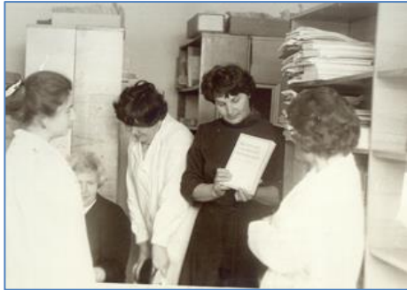
День кафедры в библиотеке ВГМИ

120 мест и книгохранилище для научных фондов. Одновременно в студенческом общежитии № 2 был открыт учебный абонемент. В библиотеке около 4 тысяч читателей. Количество фонда приблизилось к 200 000 экз. Для научной библиотеки получено новое оборудование, отредактированы каталоги, стали широко приобретать и использовать в работе информационные издания. Систематическое справочно-библиографическое обслуживание читателей ведется с 1972 года, когда был организован справочно-библиографический отдел. В эти же годы началось систематическое проведение занятий по «Основам библиотечно-библиографических знаний».