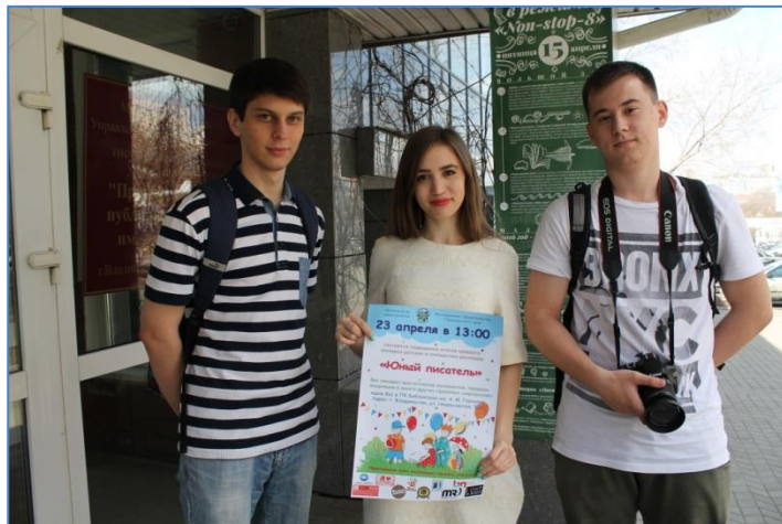
Организаторы конкурса «Юный писатель», члены Молодёжного правительства Приморского края