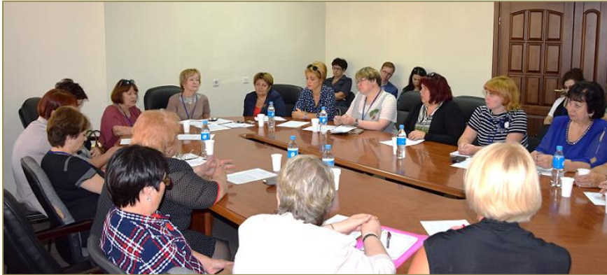
Рабочий момент конференции. Круглый стол

«Информационные ресурсы фонда редкой и ценной книги: изучение и продвижение», «Проблемы подготовки библиотечных кадров».