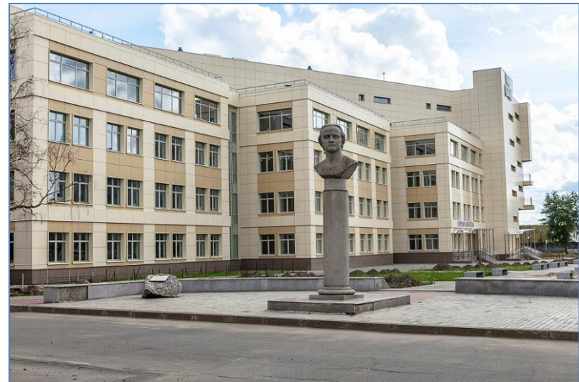
Новое здание Интеллектуального центра – научной библиотеки САФУ (Северного (Арктического) федерального университета, г. Архангельск)

Активная включенность Интеллектуального центра – научной библиотеки САФУ в развитие университета и местных сообществ помогает соответствовать современным трендам и отвечать на вызовы развития библиотек: развивать информационно-коммуникационные технологии, быть клиентоориентированными, многофункциональными и готовыми к стремительному росту объемов информационных ресурсов в парадигме открытой науки.