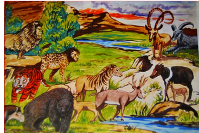
Майн Рид «Охота на медведей» и Игорь Акимущкин «Дикая жизнь Гондваны»