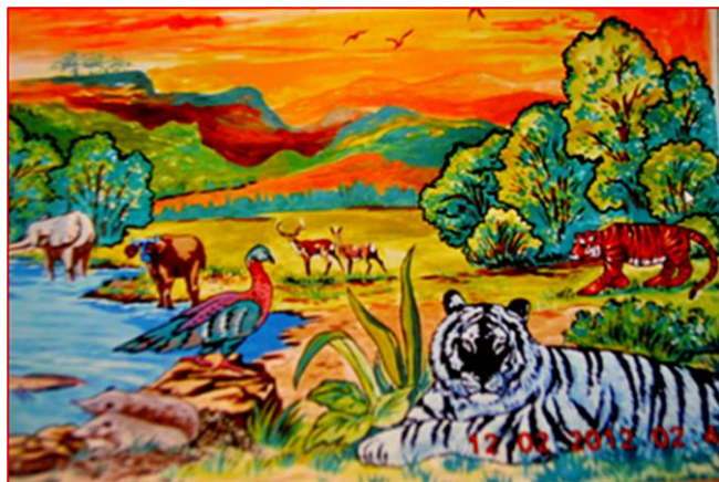
Совмещение романа Жюль Верна «5 недель на воздушном шаре» и «Дикая жизнь Гондванс» Игоря Акимущкина