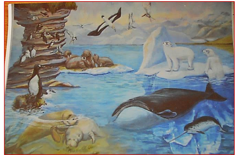
Картина к роману Жюль Верн «Путешествия и приключения капитана Гаттераса»