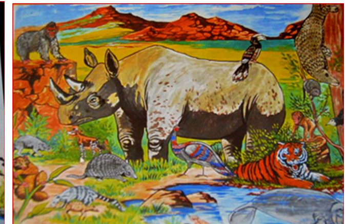
Роберт Балантайн «Африканский тигр» или Дикая жизнь Гондваны»