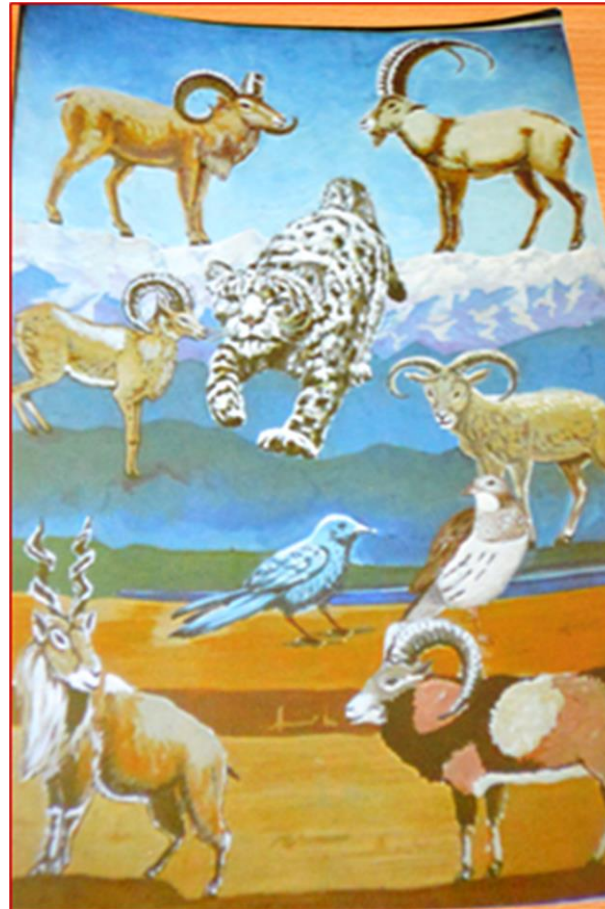
Горы Средней Азии