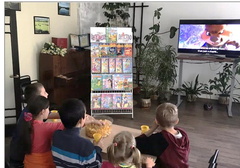
Работает мульти-зал «Калейдоскоп»

Самых активных юных читателей книжного лета на итоговом празднике сотрудники библиотеки наградили грамотами, сладкими подарками и памятными призами.