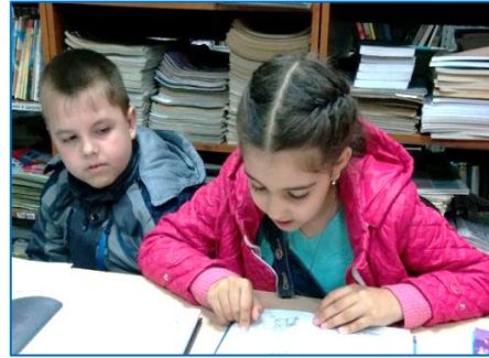
Школа вежливых наук «Азбука этикета»

В проведенных мероприятиях мы использовали разные формы занятий: игровые, интеллектуальные, театрализованные, конкурсные, а также совокупность приемов и форм. Всё вместе это развивает творческие способности и креативное мышление. Иными словами, на каждом мероприятии детям давалась сначала теория, а затем она закреплялась практической частью в игровой форме.