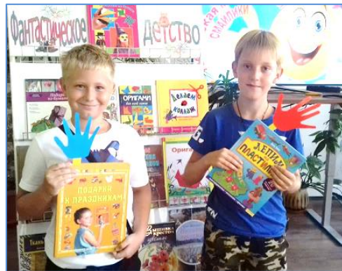
Творческая мастерская «Смайлики»

В творческой мастерской «Смайлики» по программе «Лето просвещения 2018» участниками стали дети из многодетных, социально незащищенных семей.