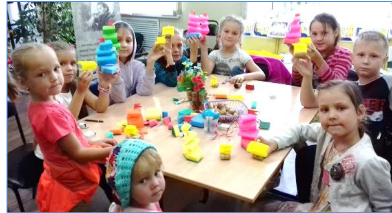
Творческая мастерская «Смайлики»

Юные читатели дружно, активно и с огромным желанием принимали участие в различных видах творчества. Ребята узнали, что с помощью простых подручных материалов можно создавать необычные, разнообразные поделки. На мастер-классах дети фантазировали и создавали свои собственные поделки из пластика, крупы, поролон, занимались изготовлением книжных закладок, овладевали мастерством квиллинга, учились мастерить куклы-обереги, клеить поделки из бумаги, делать пластиковые стаканчики, ложки. Все задания были запланированы таким образом, чтобы дети могли выполнить поделки разной сложности, так как участниками творческой мастерской были и дошкольники. Подборка книг и альбомов из фондов библиотеки познакомила детей с разными видами декоративно-прикладного искусства. Дети читали и смотрели познавательные книги Светланы Ращупкиной «Подарки из бумаги», Татьяны Морозовой «Оригами», Вернер Шульце «Зверушки из пробок», Валентины Пудова «Игрушки из природных даров».