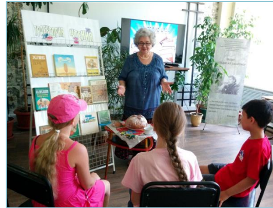
Книжная гостиная «Траектория чтения»

Три месяца для детей работала в библиотеке книжная гостиная «Траектория чтения». Здесь прошёл ряд интересных встреч, в одной из которых, под названием «Сохрани русское слово», ребята прикоснулись к самому большому достоянию нашей культуры – к богатому русскому языку.