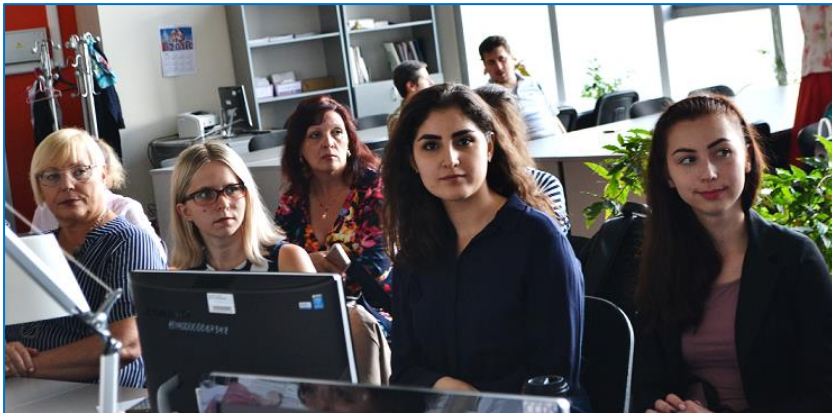
Участники видеоконференции, «Университетские традиции высшего исторического образования в Санкт-Петербурге и на Дальнем Востоке», 2018 г.

На огромных просторах нашего государства, к востоку от Урала, к началу XX века было только два высших учебных заведения. Первое учебное заведение в Томске – Томский императорский университет. В отличие от наших других восьми российских университетов, в этом университете не было историко-филологического факультета.