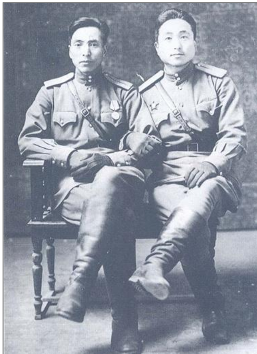
Фото из китайских источников, рассказывающих о китайских героях интернациональной бригады, внёсших свой вклад в победу над японским агрессором

В начале их расквартирования создали два лагеря: «А» – в Туркмении и «Б» – в 75 километрах от Хабаровска в селе Вятское. Летом 1942 года советская сторона приняла решение о переформировании лагерей «А» и «Б» в одну учебную бригаду. Приказом командующего Дальневосточным фронтом генерала армии Иосифа Родионовича Апанасенко № 00132 от 21 июля 1942 года было создано это войсковое соединение и расквартировано в селе Вятское.