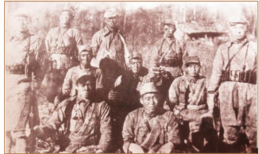
Бойцы (разведчики) 88-й бригады

В 1942 году, после консультаций и переговоров между Китаем и Россией, это подразделение было реорганизовано в 88-ю независимую пехотную бригаду Советской Красной Армии (сокращенно 88-я бригада). На самом деле это была команда, которая выполняла специальные задачи. Лидерами этой команды были Чжоу Баочжун, Ли Чжаолин и Фэн Чжунюнь, а также другие офицеры и солдаты, некоторые