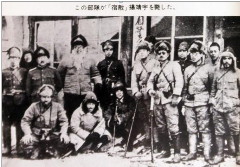
Захваченные в плен японские офицеры

Маньчжурии, Муданьцзяне и других районах, участвовало в борьбе с японскими войсками. Так китайские герои сражались за освобождение КНР и стремились вернуться на свои земли. Как участники битв они стали первыми из своего народа свидетелями поражения японских захватчиков.