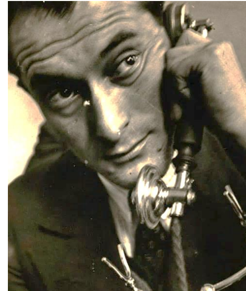
Писатель Евгений Петров

Было ему, как и умершему пятью годами раньше соавтору, 39 лет.