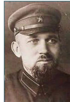
Директор «Дальстроя» Эдуард Петрович Берзин

Берзинские времена на Колыме позже вспоминали как благословенные. О первом директоре «Дальстроя» хорошо отзывался Шаламов, знавший его ещё по Северному Уралу, где писатель отбывал первый срок и участвовал в строительстве химзавода под берзинским руководством: «Эдуард Петрович Берзин пытался, и весьма успешно, разрешить проблему