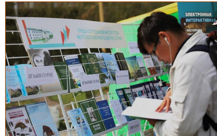
Межрегиональная книжная выставка-ярмарка «Печатный двор Якутии»

Цели выставки – укрепление и расширение связей участников республиканского, дальневосточного и российского издательского рынка, обеспечение конструктивного взаимодействия всех