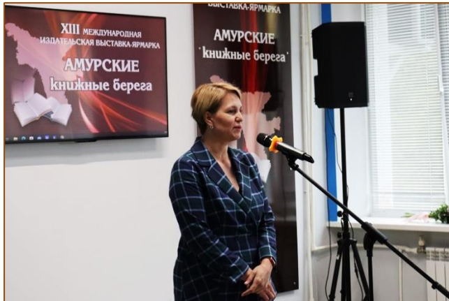
Межрегиональная издательская выставка «Амурские книжные берега»

Помимо рассмотренных выше книжных выставок-ярмарок с 2006 г. в Амурской области один раз в два года на базе Амурской областной научной библиотеки им. Н.Н. Муравьева-Амурского проводится Межрегиональная издательская выставка «Амурские книжные берега» – главный издательский форум Амурской области.