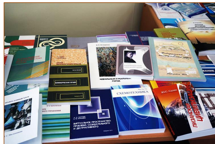
Выставка под девизом «Книга на службе социально-экономического и культурного развития Хабаровского края»

Хабаровского края и 100-летию со дня рождения классика дальневосточной литературы Всеволода Сысоева (девиз: «Книга – территория интеллекта и духовного обогащения нации»), четвёртая (2014 г.) – Году культуры в России и 120-летию Дальневосточной государственной научной библиотеки (девиз: «Книга на службе социально-экономического и культурного развития Хабаровского края»), пятая (2017 г.) – Году экологии в России (девиз: «Книга на службе социально-экономического и культурного развития Хабаровского края»).