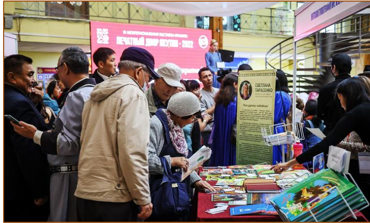
Большая популярность Межрегиональной книжной выставки-ярмарки «Печатный двор Якутии»

полиграфическом деле и распространении высококачественной литературы, поддержка комплектования фондов библиотек [9].