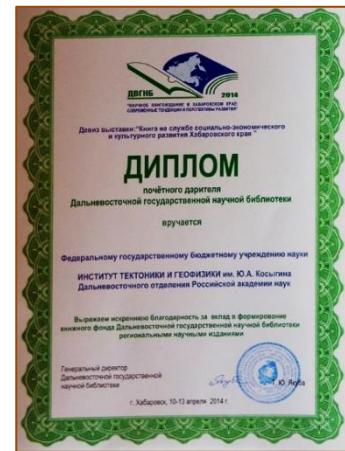
Диплом «Почётный даритель ДВГНБ»

Дальневосточный институт управления) (2008 г.), Хабаровского государственного института культуры (2014, 2017 гг.), Хабаровской духовной семинарии (2011 г.), Центра изучения международных отношений в Азиатско-Тихоокеанском регионе при Дальневосточном государственном гуманитарном университете (ныне – Педагогический институт ТОГУ), (2014 г.), Хабаровского краевого музея им. Н. И. Гродекова (2005, 2011, 2014 гг.), Дальневосточной государственной научной библиотеки (2005, 2008, 2014 гг.), Хабаровской краевой типографии (2008, 2014 гг.),