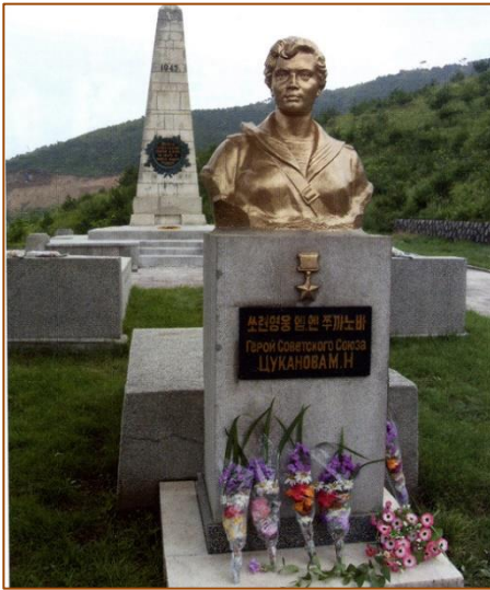
Памятник с бюстом Марии Цукановой, установленный в 2008 г. в КНДР на сопке Комальсам

За двое суток непрерывных боёв Маша вынесла с поля боя пятьдесят два бойца, спасла их от неминуемой гибели. Последним из них был краснофлотец Константин Плоткин, испанец по происхождению, усыновлённый в России.