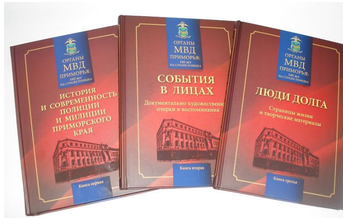
Трёхтомник «Органы МВД Приморья: 160 лет на страже порядка»

организация города Владивостока очень хорошо поработала. Из Пограничного нам передали много интересных материалов. На издание книги были мобилизованы ветеранские организации всех органов. Я помню, какие интересные материалы поступили, например, с Дальнереченска. Архивные! А с Дальнегорска был не просто интересный материал, но ещё и в фотографиях разных лет.