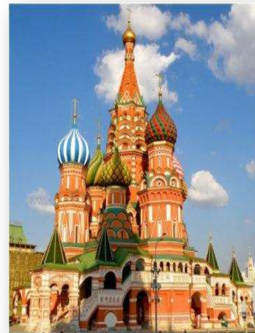
Церковь Покрова на рву Храм Василия Блаженного

Данное «Окончание книги Степенной...» представляет историю освящения церкви Покрова на рву в Москве, или храма Василия Блаженного.