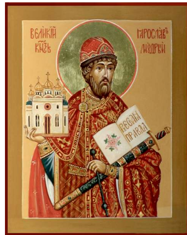
Ярослав Владимирович (Мудрый) (978 – 1054)

В данном сборнике «Русские Достопамятности» опубликован список (текст) – «Номоканон» из Кормчей книги, который древнее изданных в XVIII веке. По данным предисловия «Суд Ярослава Владимировича. Правда Русская» был написан в 1282 г. по повелению князя Новгородского Дмитрия, на средства Архиепископа Новгородского Климента и положена в церкви святой Софии на почитание священникам и на послушание крестьянам, а себе на спасение души.