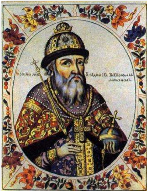
Владимир Всеволодович Мономах (в крещении Василий) (1053 – 1125)

Следующая статья сборника – «Послание Никифора Митрополита Киевского к Великому Князю Владимиру, сыну Всеволода, сына Ярослава».