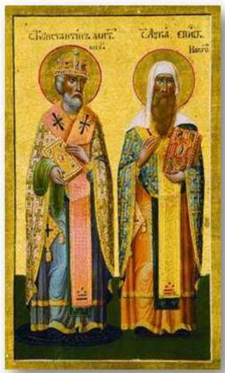
Святители Константин Киевский и Лука Новгородский. Клеймо иконы «Собор Русских святителей». 60-е годы XIX века. Князь-Владимирский собор (Санкт-Петербург).

В предисловии к тексту «Поучение Архиепископа Луки к братии» поставлен вопрос об авторстве данной рукописи. Рукопись приписывает авторство «Поучения...» Луке Жидяте – Архиепископу Новгородскому с 1033–1059 гг.