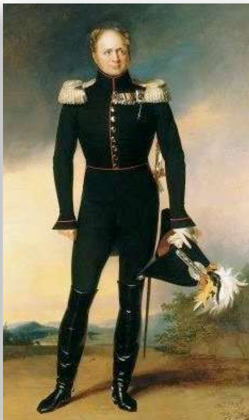
Александр I (1777–1825)

Члены Общества Исторіи и Древностей Россійскихъ.