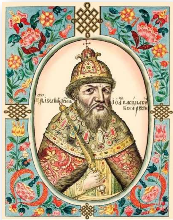
Иоанн IV Васильевич, прозванный Грозным (1530 – 1584)

В сборнике «Русские Достопамятности» представлены списки (тексты) трех Грамот Царя Иоанна Васильевича, полученный Обществом от Пресвященного Евгения (Епископа Вологодского). Список публикуется без изменений с общими замечаниями и объяснением первой Грамоты: