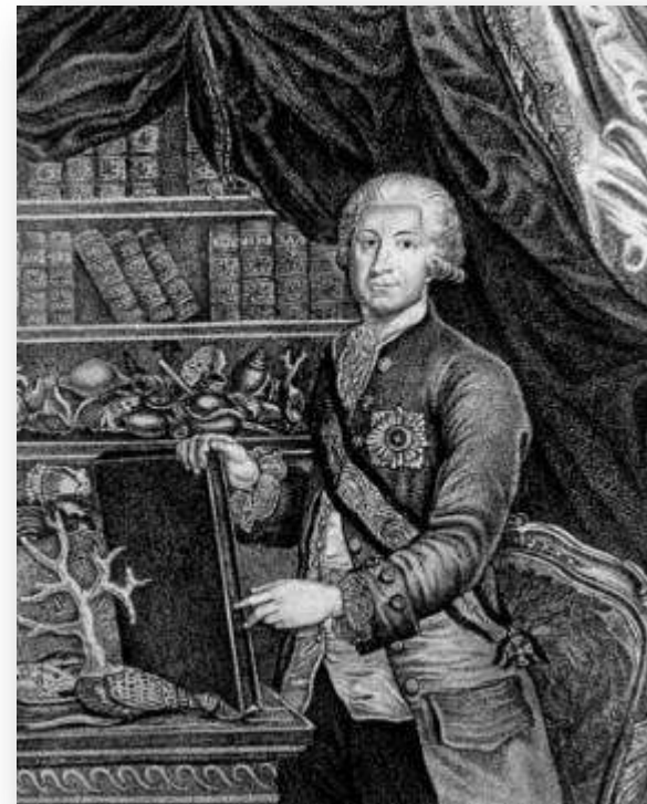
Демидов Павел Григорьевич (1739–1821)0

Иван Тихонович Посошков (1652–1726) – первый русский экономист-теоретик, мыслитель, публицист, предприниматель, изобретатель; сторонник военных и экономических преобразований Петра I.