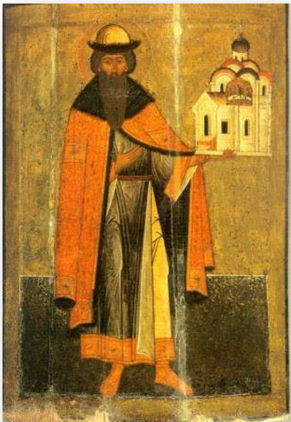
Святой благоверный князь Всеволод Псковский, в крещении Гавриил (икона конца XVI века)

Следующим в сборнике (ст. 4) представлен текст «Грамоты Новгородского князя Всеволода». Всеволод Мстиславич (1095–1138) в начале XII века дал эту грамоту Новгородской церкви Иоанна Предтечи, построенной Великим князем Иоаном в 1127 – 1130 гг.