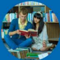
Бакалавриат и специалитет