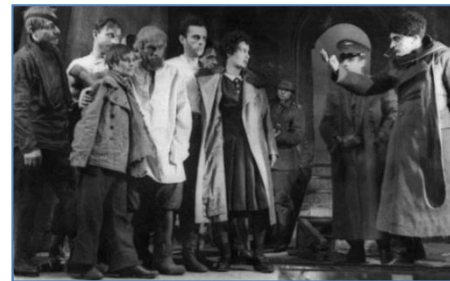
Сцена из спектакля К. Симонова «Русские люди», 1942 г.