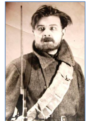
Герой спектакля Н. Погодина «Человек с ружьем», 1940 г.

Продолжая славные традиции героической драмы, сложившейся у нас в 1920–30-х годах («Шторм», «Любовь Яровая», «Разлом», «Оптимистическая трагедия», «Человек с ружьем» и др.),