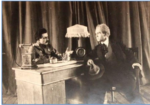
Сцена из спектакля «Слава» В. Гусева, 4-е действие, ДВК, Сысоевка, 25 апреля 1939 г.

Дальнего Востока стоящие перед ними задачи по защите социалистического Отечества» 5 .