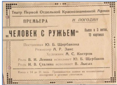
Программа спектакля «Человек с ружьём», 1940 г.

лучшие пьесы периода Великой Отечественной войны насытили эти традиции новым конкретно-историческим содержанием, развили и обогатили их и в своей совокупности составили яркую страницу в истории советской драматургии.