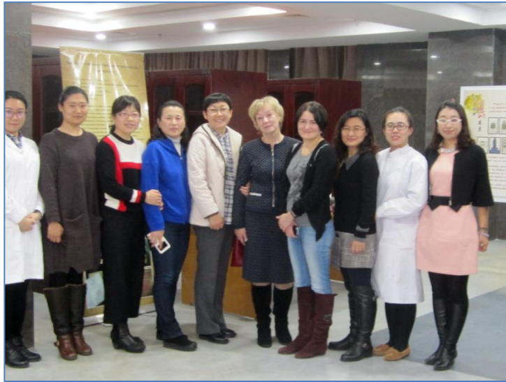
В отделе редких книг Библиотеки Цзилинского университета

Много интересной информации мы почерпнули в этой поездке и надеемся, что наше сотрудничество с Цзилинским университетом, Северо-Восточным педагогическим университетом (г. Чанчунь) и другими международными университетами будет продолжаться, чтобы мы могли учиться друг у друга передовому опыту, обмениваться знаниями и уникальной полезной информацией.