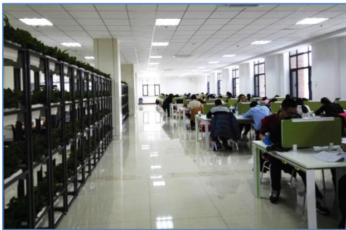
В одном из читальных залов Библиотеки Цзилиньского университета

Библиотека работает сейчас одновременно на двух площадках, что для нас не очень хорошо. Понятно, что мы должны быть в одном месте: там, где находится большая часть наших пользователей. Мы призваны обеспечивать комфортность библиотечной информационной среды, и весь объём наших ресурсов должен быть удобно размещён, в шаговой доступности, и предоставлен студентам и преподавателям. Этому требованию подчинена архитектура здания и организация его внутреннего пространства в наших читальных залах на острове Русском: всё здесь максимально направлено на удобную самостоятельную работу читателей. Надеемся, что со временем эта же перспектива появится и у всего комплекса нашей Научной библиотеки.