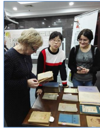
В отделе редких книг Библиотеки Цзилиньского университета

Можно много говорить и о технических новшествах библиотеки Цзилиньского университета, и об организации её работы с редкими изданиями – она располагает уникальным фондом, некоторым экземплярам которого до одной тысячи лет. И в составе Отдела этого фонда работают люди со знанием иностранных языков, что позволяет им изучать оригиналы текстов на том языке, на котором они были созданы.