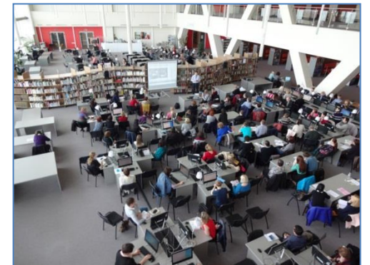
В читальном зале гуманитарной литературы Научной библиотеки ДВФУ

В университете реализуется новая образовательная модель подготовки бакалавров «Образование 2.0», в рамках которой организация самостоятельной подготовки студентов обязательно касается активного использования информационных ресурсов. Новая организация библиотечного пространства, которая создана в кампусе ДВФУ на острове Русском в