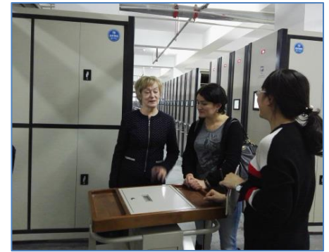
Книгохранилище Библиотеки Цзилиньского университета