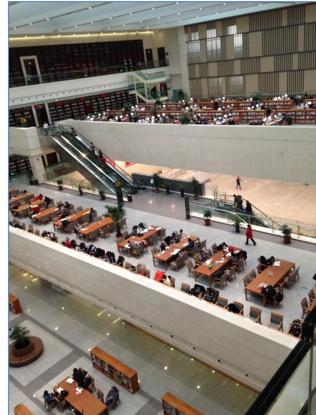
Национальная библиотека провинции Цзилинь, г. Чанчунь

Много интересной информации мы почерпнули в этой поездке и надеемся, что наше сотрудничество с Цзилинским университетом, Северо-Восточным педагогическим университетом (г. Чанчунь) и другими международными университетами будет продолжаться, чтобы мы могли учиться друг у друга передовому опыту, обмениваться знаниями и уникальной полезной информацией.