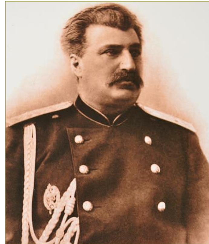
Ил. из кн.: Н.М. Пржевальский. Путешествие в Уссурийском крае. М., 1947

населении» [5, с. 220]. Ученик и последователь Н. Пржевальского, известный путешественник Петр Кузьмич Козлов так написал в своей монографии об этой экспедиции Пржевальского: «В 1867 году он едет в Иркутск и получает двухлетнюю служебную командировку в Уссурийский край; сверх того, Сибирский отдел Географического общества поручает ему описать флору и фауну и собрать зоологическую и ботаническую коллекции» [6, с. 33]. Во всех этих словах выражалось главное: перед молодым Пржевальским стояли грандиозные задачи комплексного изучения