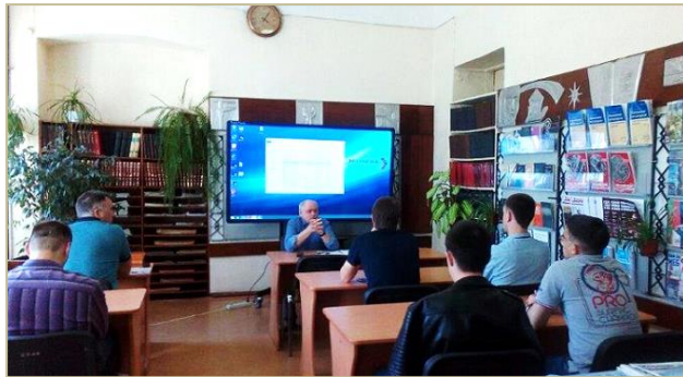
НТБ. День специалиста - сварщика

специальные периодические издания для библиотеки и служб завода – на сегодняшний день мы выписываем более 70 названий периодических изданий. С 1993 г. библиотека начала формировать электронный каталог, и он уже насчитывает более 35.000 библиографических записей, которые позволяют по любым параметрам найти нужную информацию. Кроме этого, в НТБ есть и фонд электронных книг на CD, а также электронные книги, которые доступны в сети завода.