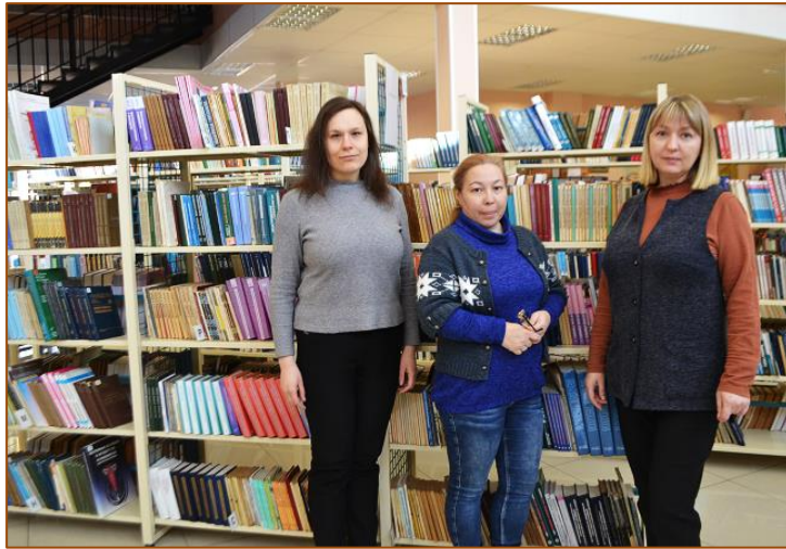
Молодые сотрудники БИЦ ТГМУ

Несомненно, успехи и достижения библиотеки за эти годы – это работа тех коллективов, которые в разные годы принимали участие во всех задачах, которые перед ними ставили руководство вуза и подразделения. Сейчас трудно всех даже перечислить. Мы помним наших ветеранов, каждый год организуем встречи с ними. И этот год не станет исключением.