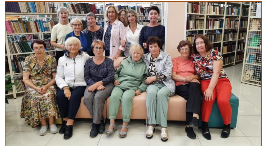
Встреча коллектива БИЦ с ветеранами библиотеки

Два года назад в БИЦ провели оптимизацию кадров. Мы лишились ряда подразделений и должностей. Сегодня в БИЦ два подразделения: отдел обслуживания и отдел формирования библиотечно-информационных ресурсов. Недавно мы вышли с