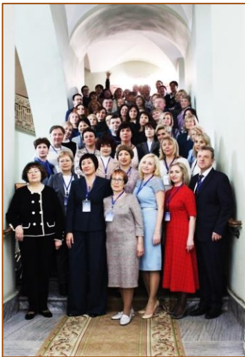
Участники Научно-практической конференции «Инновационные технологии в информационном обеспечении образования, науки, здравоохранения», Санкт-Петербург, 2022г.