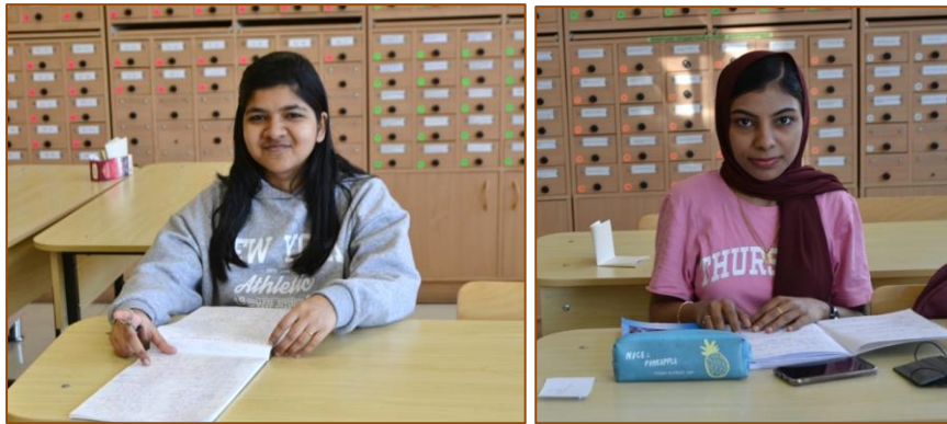
Иностранные студентки за работой в библиотеке ТГМУ

доступа к комплекту «Books in English» и электронные ресурсы «ClinicalKey Student Foundation» издательства Elsevier для учебно-методического обеспечения дисциплин специальностей. Нами были организованы образовательные мероприятия по работе с электронными ресурсами БиЦ для иностранных студентов, обучающихся на английском языке и преподавателей. Впервые проведена удаленная регистрация в ЭБС БиЦ иностранных пользователей из Китая. Продолжили мы обучение китайских