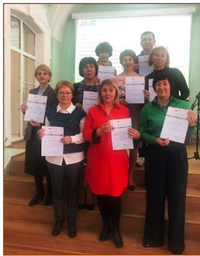
Топ 10 в VIII независимом рейтинге сайтов библиотек медицинских вузов

Форуме «Информационные технологии в медицинских библиотеках», который проходил в г. Санкт-Петербурге. Это ещё один многолетний проект АМБ, который позволяет принять участие в работе интереснейших секций, передать опыт своей работы и поучиться у коллег, привезти новые впечатления.