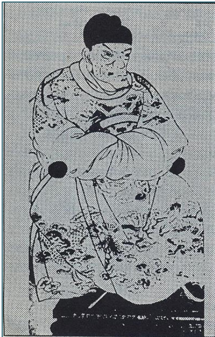
Чжу Юаньчжан, основатель династии Мин. Портрет XV века

Во второй половине IX в. на северо-западных границах империи усилилось Тангутское царство Западное Ся (дата образования 1038 г.). Дипломаты Китая, не желая проводить военные кампании, постоянно вели переговоры с Западным Ся, также заключая перемирия с территориальными уступками и ежегодными выплатами. Сунский двор, начиная с 1044 г., также преподносит тангутам в качестве «дара» большое количество шёлка, серебра и чая [4, с. 88]. Усиление тангутского государства резко ослабило связи Сунской империи с Западом, так