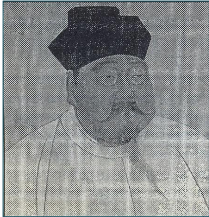
Чжао Куань-инь, основоположник Сунской династии

В VIII – IX в. китайские императоры часто прибегали к помощи кочевых племён и иноземных государей во время мятежей внутри государства и народных восстаний, а затем старались откупиться и не попасть под их влияние. «Великий шёлковый путь дополнился новыми сухопутными (из Сычуани в Бирму и Бенгалию, через Тибет – в Непал и Северную Индию, которыми пользовались в основном буддийские паломники) и морскими маршрутами, связывавшими Китай с Японией и с мусульманско-арабским миром: путь от Багдада до Гуанчжоу» [3, с.72]. В качестве итогов этой эпохи выделяют: сильную оборону государственных границ, окончательный распад Тюркского каганата, расширение территорий государства, установление отношений с другими государствами, развитие торгового обмена, политику открытости.