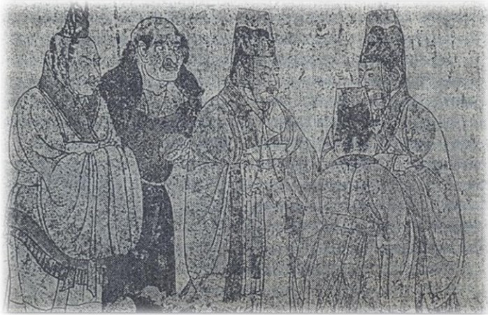
Послы из дальних стран, фрагмент фрески эпохи Тан (из кн. В.В. Малявина)

Представителями средневековья традиционно считаются империи Суй (581 – 618), Тан (618 – 907), Сун (960 – 1127) и Мин (1368 – 1643) [3, с. 407]. Вне зависимости от правящей династии на протяжении всего этого времени внешняя политика Срединной империи обладала схожими чертами. Главная задача, которую приходилось решать каждому правителю, заключалась в необходимости защищать границы государства на всей его территории. Средствами достижения внешнеполитических целей служили сложная дипломатия и открытые войны. Наиболее характерными дипломатическими приёмами были: натравливание одних племён на другие; разжигание внутривременной розни;